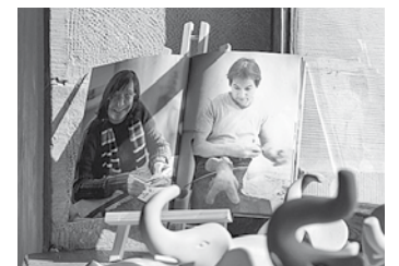
Wärchbrogg (Hg.): Augenblicke. Die Kunst, glücklich zu sein. Mit Fotografien von Michael Walker. 2012. CHF 38.–

Zum Jubiläum ein toller Fotoband: Michael Walker hat vierzig Mitarbeitende der Wärchbrogg bei ihren liebsten Beschäftigungen fotografiert.